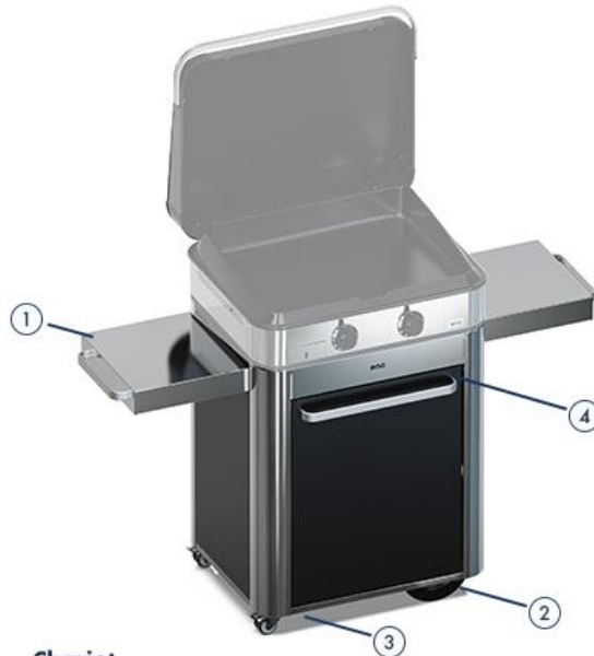
Chariot 1 - Tablettes coulissantes 2 - 2 roues tout terrain 3 - 2 roues pivotantes avec frein 4 - 1 porte - poignée aluminium